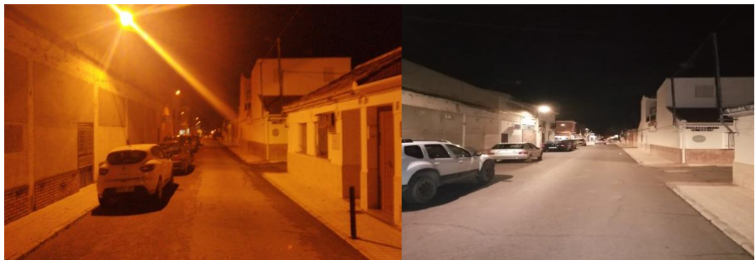
Imagen comparativa de Calle Séneca

Descripción: Primera fase de renovación de instalaciones de alumbrado exterior mediante cambio a tecnología LED, con el objetivo de conseguir ahorro energético y una economía más limpia y sostenible.